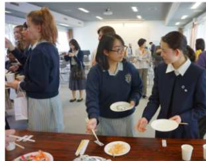
フェアウェルパーティー