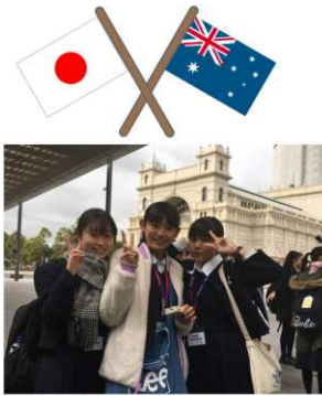
皆でメルボルン市内を散策。