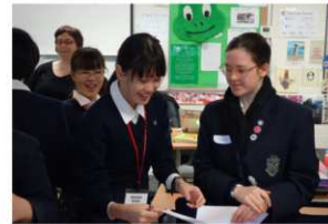
〔授業体験〕 信愛生は英語で、コロンバス生は日本語で、お互いに学び合います。