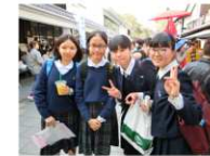
熊本城城彩苑にて。