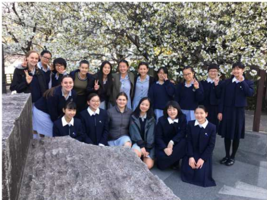
熊本市内を散策、熊本城近くでの一枚。

3年に一度、日本語を学ぶコロンバス生のジャパンツアーが実施されます。その際、2週間程度コロンバス生が信愛生の自宅にホームステイし、授業に参加したり、史跡を巡るなどの体験活動を行います。写真は、2018年3月に実施したものです。