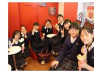
上通り・下通りなど市街地の散策。