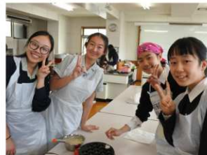
たこ焼き作り 日本画の技法 浴衣着付け 茶道、箏曲 などの体験活動